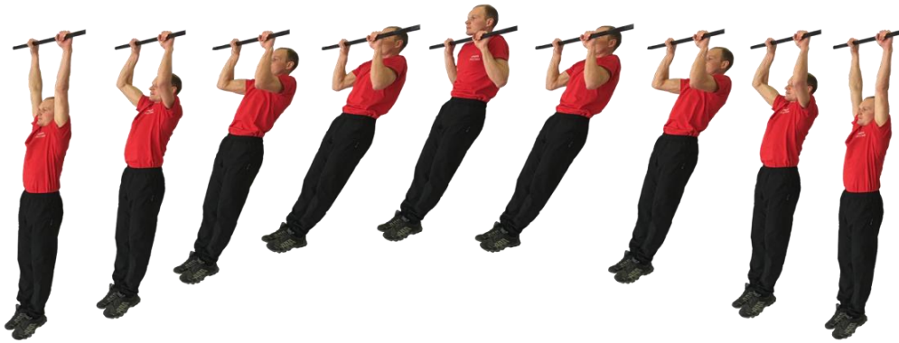
Рис. 1. Подтягивание на перекладине