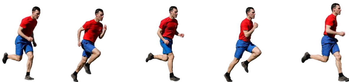
Рис. 5. Бег на 60 м, бег на 100 м