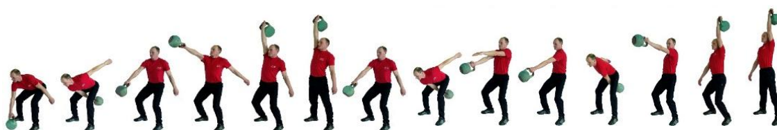
Рис. 4. Рывок гири

При нарушении условий выполнения упражнения повторение не засчитывается, подается команда «НЕ СЧИТАТЬ».