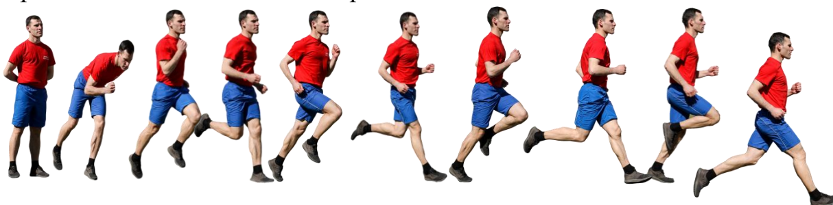
Рис. 7. Бег на 1 км, бег на 3 км.

Старт и финиш, как правило, оборудуются в одном месте. При выполнении упражнений на беговой дорожке стадиона старт и финиш производится в соответствии с разметкой стадиона.