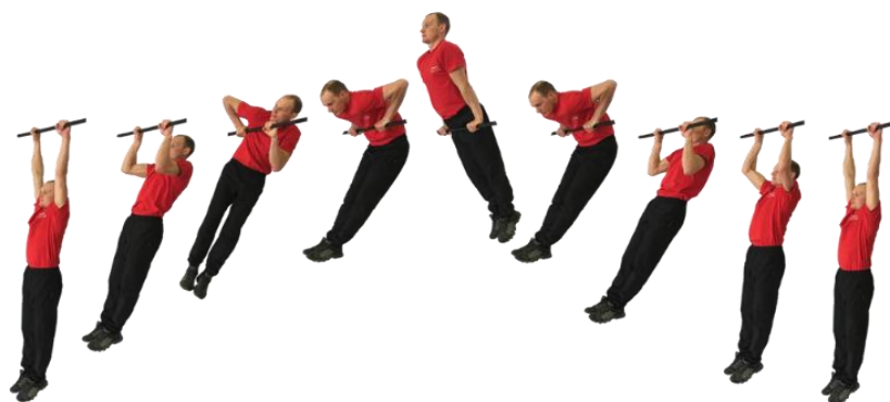
Рис. 3. Подъем силой на перекладине