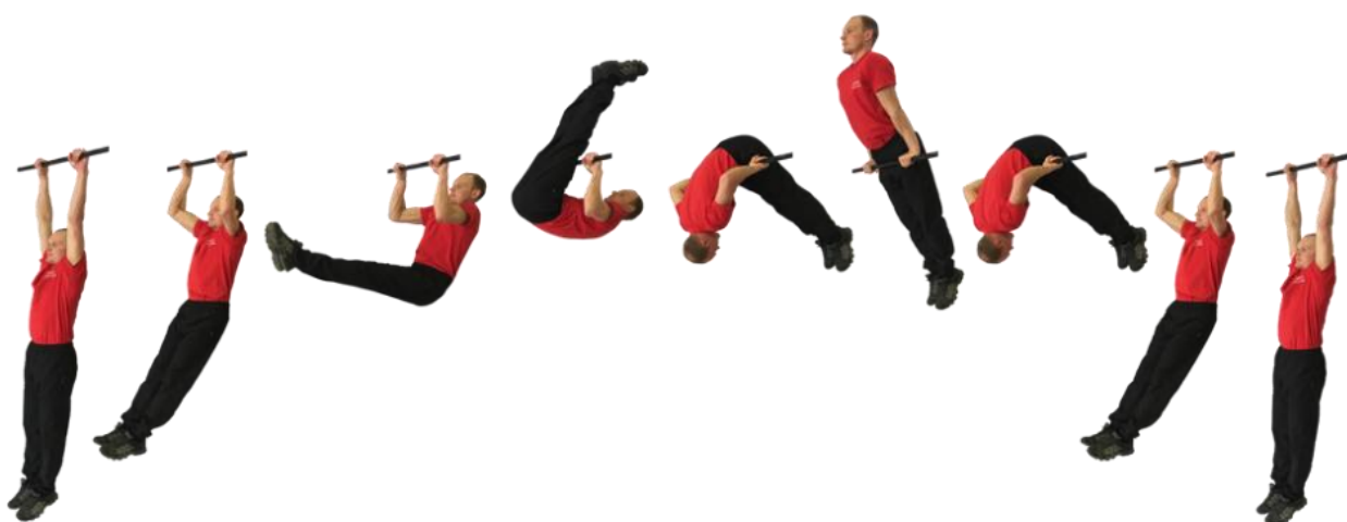
Рис. 2. Подъем переворотом на перекладине