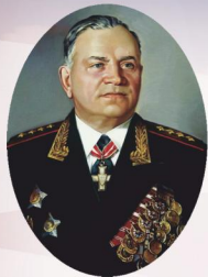
Генерал армии А.В. Хрулёв

Военная орденов Кутузова и Ленина академия материально-технического обеспечения имени генерала армии А.В. Хрулёва Министерства обороны Российской Федерации прошла большой и славный путь своего становления и развития. Она ведет свою историю с 31 марта 1900 года, когда в столице России – Петербурге впервые в мире было создано специальное военно-учебное заведение тыла – Интендантский Курс для подготовки офицеров и чиновников интендантского ведомства.