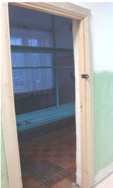
Вариант 1 Фото 14